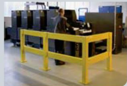
Photo: Poteau extrémité, poteau central, poteau angle, poteau simple 100 cm Hauteur