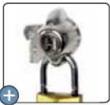
Serrure décondamnabile en option

Compact et robuste, un maximum de casiers dans un espace réduit avec 3, 4 ou 5 cases par colonne