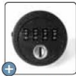
Serrure à code en option