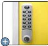
Serrure électronique en option