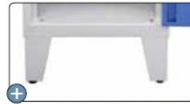
Existe sur pieds soudés (avec vérins de réglage) en acier peint: REFERENCE/PS ou en inox peint: PIEDS/SOUD/OX/NEW